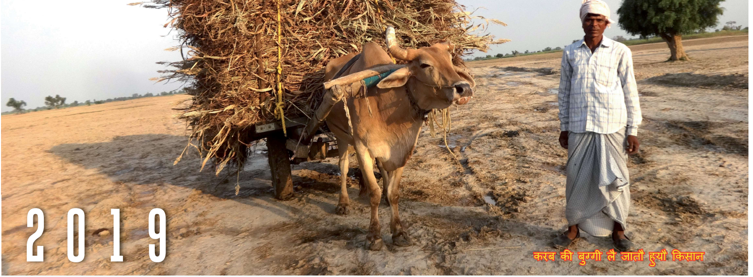
करब की बुगगी लै जातौं ह्यो किसान

नीयत कितनी भी बढ़िया हो दुनिया हमनै हमारे दिखावे ते जानै, पर दिखावो जितनो भी अच्छो हो भगवान हमेसा हमारी नीयत ते जाने।