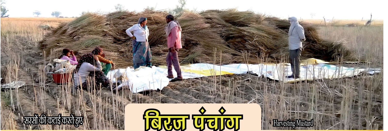
ससों की कटाई करते हुए

रात ठंडी जल्दी सोनी और सुबह जल्दी उठनी, माँझ ऐ स्वस्थ, धनी और बुद्धीमान बनावै है।