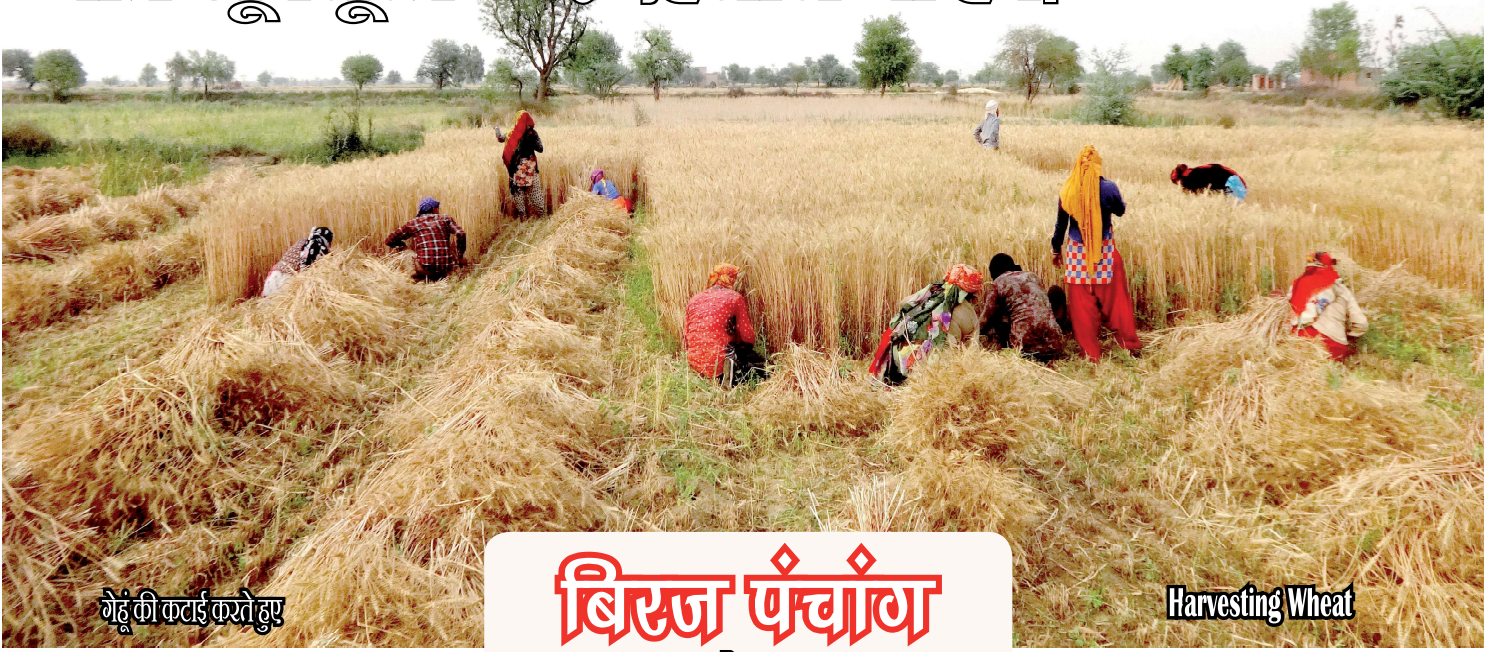
गेहूँ की कटाई करते हुए